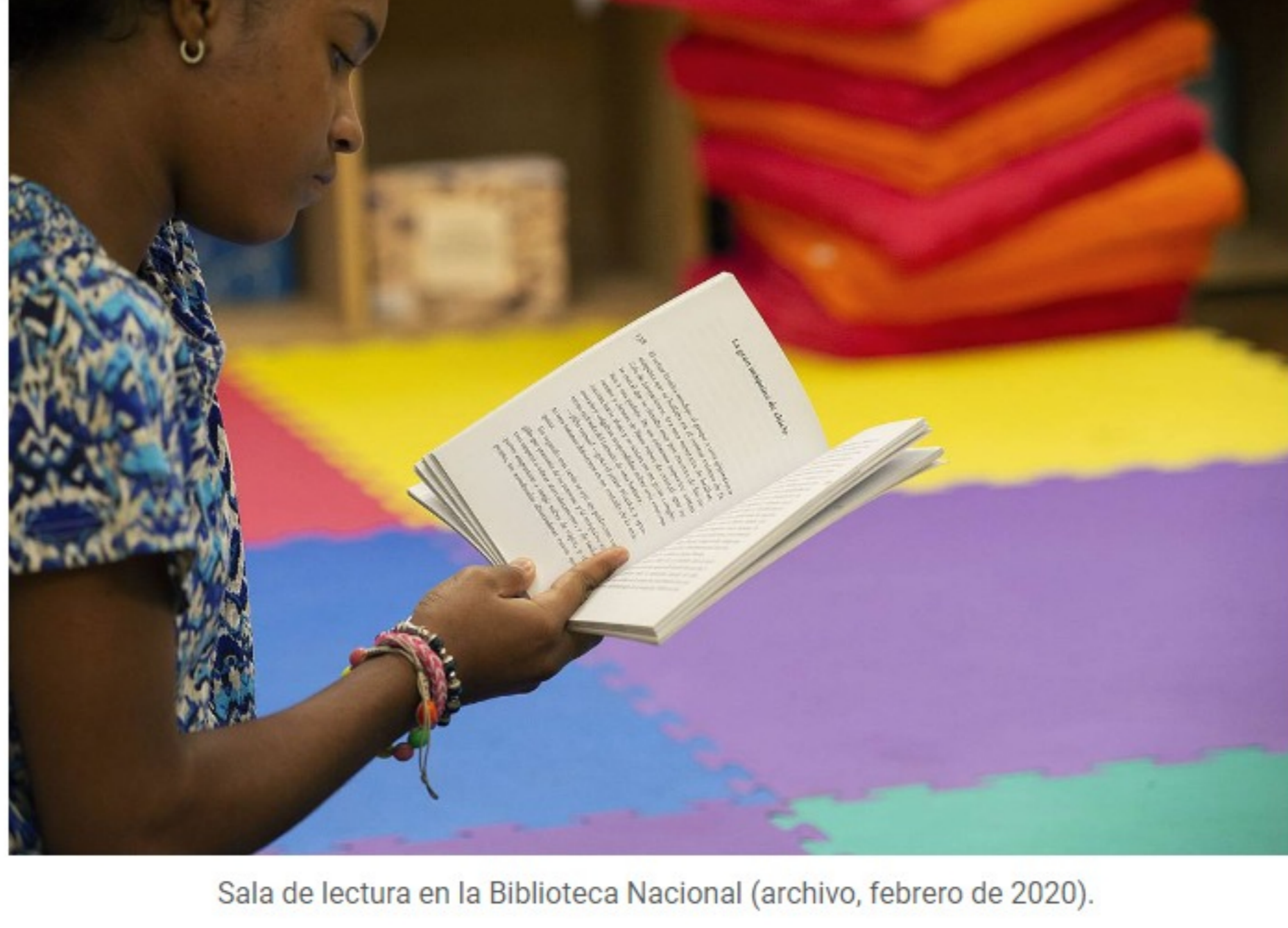
Sala de lectura en la Biblioteca Nacional (archivo, febrero de 2020).